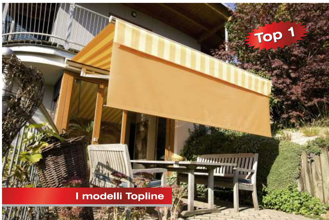
I modelli Topline

A chi poi ricerca il massimo delle prestazioni e del design, USFA propone la serie Topline, con braccia pieghevoli munite di ben quattro cavi d'acciaio interni che permettono alla tenda di sporgere fino a 4,5 metri. I modelli Topline possono anche essere dotati di dispositivo elettrico per la regolazione della lunghezza del volano, che può scendere fino a 1,5 metri, riparando dalla luce anche quando il sole è basso. Combinando tre esemplari Topline lateralmente, si possono ottenere fino a 19 metri di ombra continua.