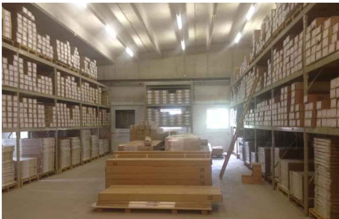
Magazzino porte Weisslack

La stessa tipologia di porta è disponibile anche con protezione dal fuoco VKF Ei 30, con luce di passaggio da 80 e 90 cm e un'altezza standard di 200 cm. Tutti gli esemplari sono certificati secondo le norme svizzere vigenti.